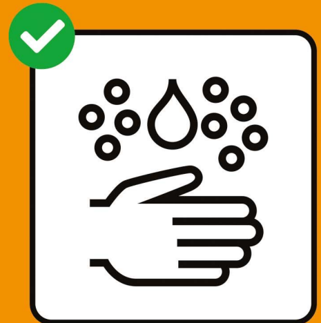
Gründlich Hände waschen.