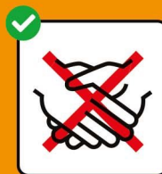
Hände schütteln vermeiden.