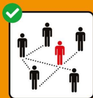
Zur Rückverfol- gung immer vollständige Kontaktdaten angeben.