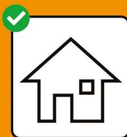
Bei positivem Test: Isolation. Bei Kon- takt mit positiv getesteter Person: Quarantäne.