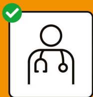
Bei Symptomen sofort testen lassen und zu- hause bleiben.