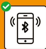
Um Infektions- ketten zu stoppen: SwissCovid App downloaden und aktivieren.