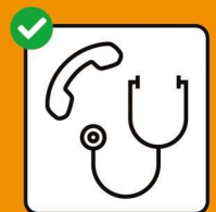
Nur nach telefonischer Anmeldung in Arztpraxis oder Notfallstation.